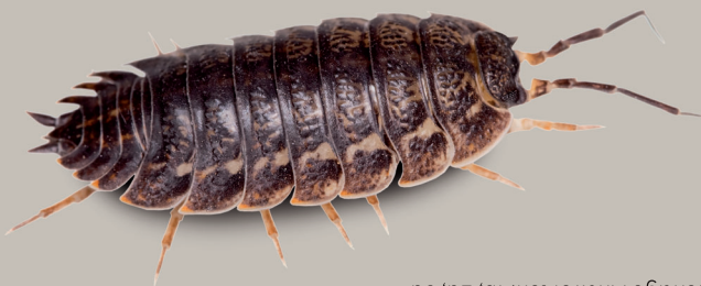
Richtige Antworten: 1b, 2a, 3d