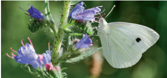
Kleiner Kohlweißling. Es gibt noch 2 weitere ähnliche Arten: Großer Kohlweißling und Rapsweißling