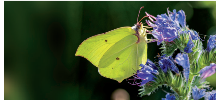
Zitronenfalter - er fliegt schon an den ersten warmen Tagen im Frühling