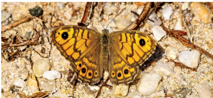
Mauerfuchs - er fliegt häufig in unseren Weinbergen