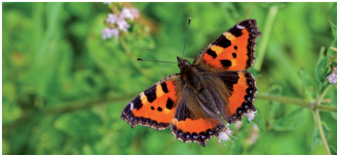
Kleiner Fuchs - seine Raupen leben auf Brennnesseln