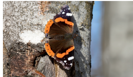
Admiral - im Herbst häufig und sogar an warmen Wintertagen zu sehen