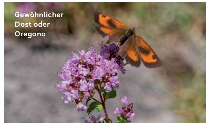
Gewöhnlicher Dost oder Oregano