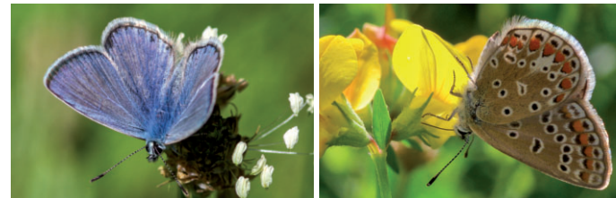
Hauhechel-Bläuling von oben und die Unterseite. Es gibt einige ähnliche Bläulingsarten, sie alle sind ziemlich klein. Du musst genau schauen, viele sind auch gar nicht blau, sondern bräunlich. Sie sind fast alle bedroht.